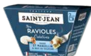
BOX DE RAVIOLES SAUCE SAINT MARCELLIN & NOIX DU DAUPHINÉ