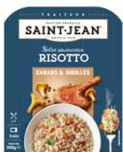
RISOTTO CANARD & GIROLLES