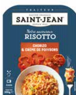
RISOTTO CHORIZO & CRÈME DE POIVRONS