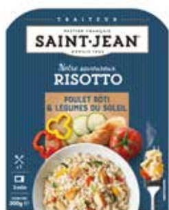
RISOTTO POULET & LÉGUMES DU SOLEIL