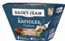
BOX DE RAVIOLES SAUCE FORESTIÈRE AUX MORILLES