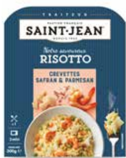
RISOTTO CREVETTES SAFRAN & PARMESAN