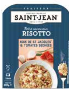
RISOTTO NOIX DE SAINT JACQUES & TOMATES SÉCHÉES