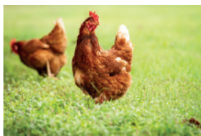
Eufs frais de poules élevées en plein air, origine Drôme

Une pâte fine à base de farine de blé tendre, moulée en petits carrés d'2 cm de côté, garnie d'une farce au Comté AOP 4 mois d'affinage minimum (et éventuellement d'Emmental français), au fromage blanc et au persil revenu au beurre.