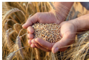
Farine de blé tendre origine France