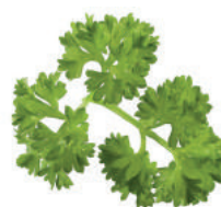
Persil de la Drôme