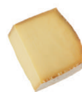
Comté AOP du Jura